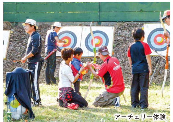
アーチェリー体験