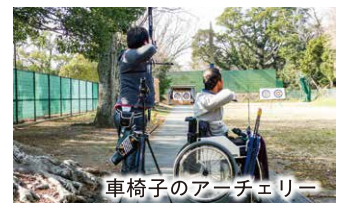
車椅子のアーチェリー